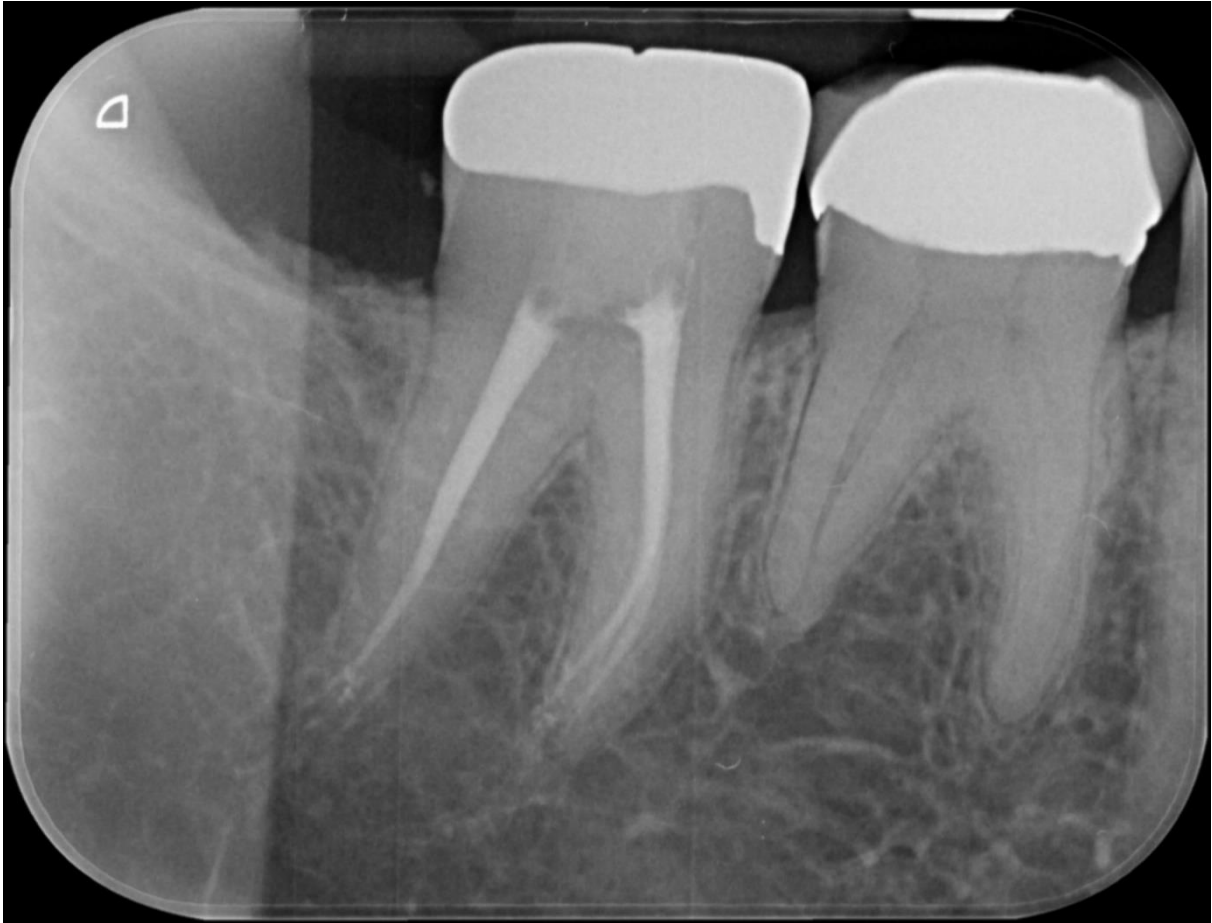
de raix in het midden ook steeds een insnoering vertoont en er dus risico bestaat op perforeren,